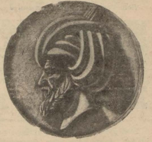
Mimar Koca Sinan 1490-1588

Bugün dâhi Türk mimarının hatırasını taziz ediyoruz