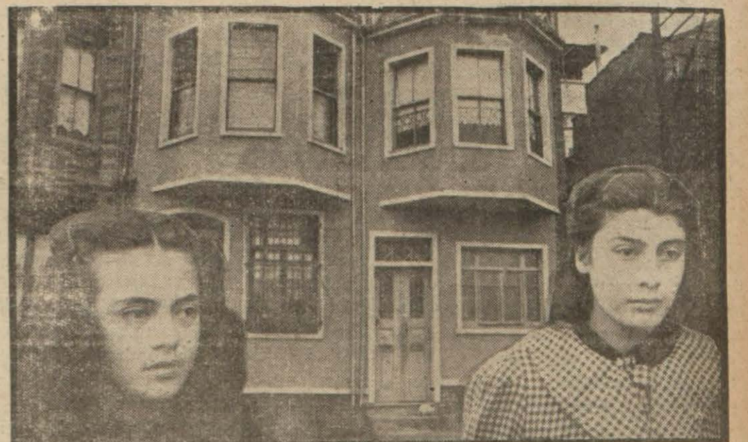
Faciaya sahne olan ev ve kurbanların çocukları (Yazısı 8 inci sayfada)